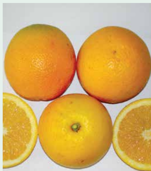
Variedades garantem ganhos de produção