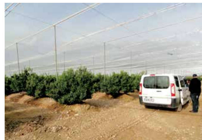
Participantes conheceram os pomares espanhóis

Os trabalhos indicaram uma tendência na procura de novas variedades destinadas ao mercado de frutas de mesa, voltadas às necessidades e preferências do mercado mundial comprador, com ênfase em frutas sem sementes, com calibre médio a pequeno, boa coloração, bom sabor e também por tipos superprecoces e tardios.