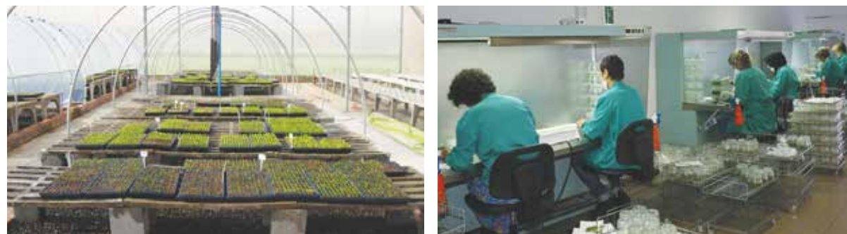
Técnicas asseguram qualidade da muda e mantêm a sanidade do parque citrícola