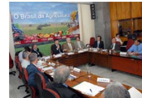
Câmara debate melhorias na citricultura

Participantes aprovaram propostas que foi encaminhada ao Mapa