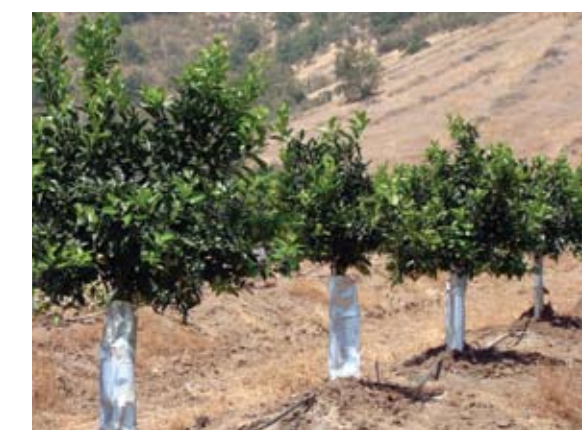
País é o terceiro maior exportador de frutos cítricos na América do Sul

Possuindo uma área total plantada de 18 mil hectares, a citricultura chilena tem como sua prin-