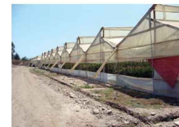
Em 2009, houve um aumento de quase 50% nas exportações chilenas de frutos cítricos

As informações destes recentes esforços permitiram que muitos atores da cadeia citrícola chilena tomassem relevantes decisões resultando em um importante crescimento nos últimos 10 anos, em área plantada e exportações.